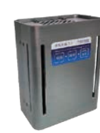
小型機種 (車載可能)